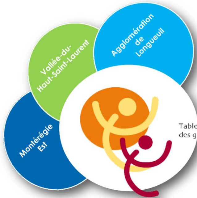
Table de concertation des groupes de femmes de la